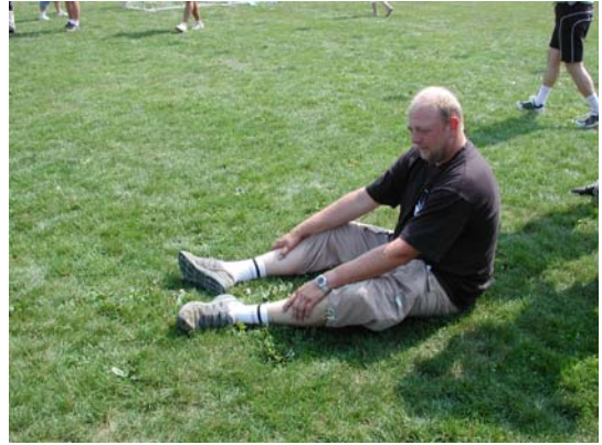
Notre syndic après l'effort ...