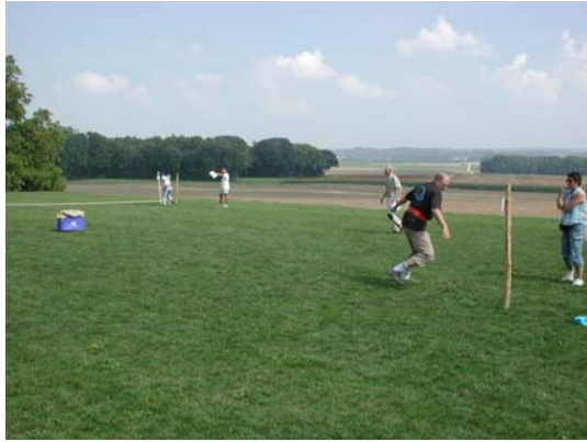
Notre syndic en pleine action ...