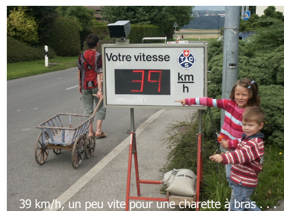
39 km/h, un peu vite pour une charrette à bras ...