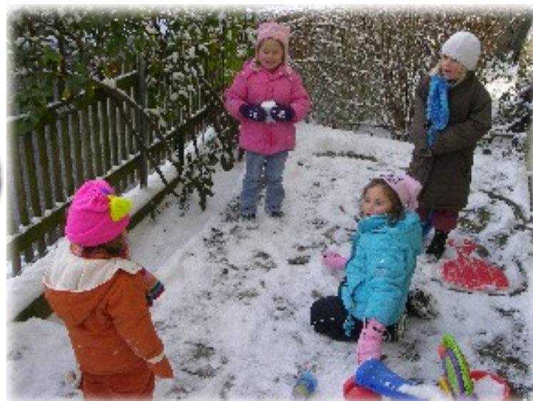
Et pendant que des enfants chantent, d'autres jouent ...