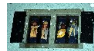
La fenêtre du 24 décembre

Les photos des fenêtres peuvent être regardées sur le site du Café de l'Union :